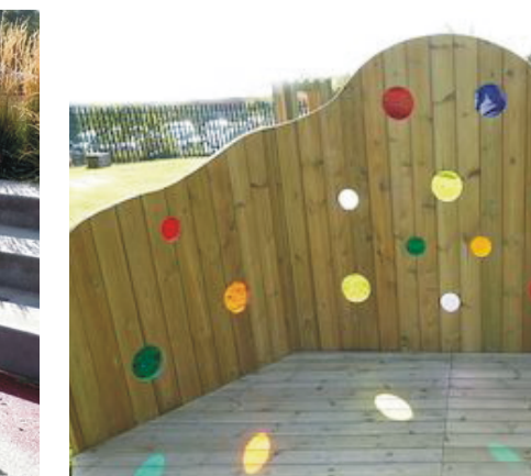
Skjólvegur við útsvið