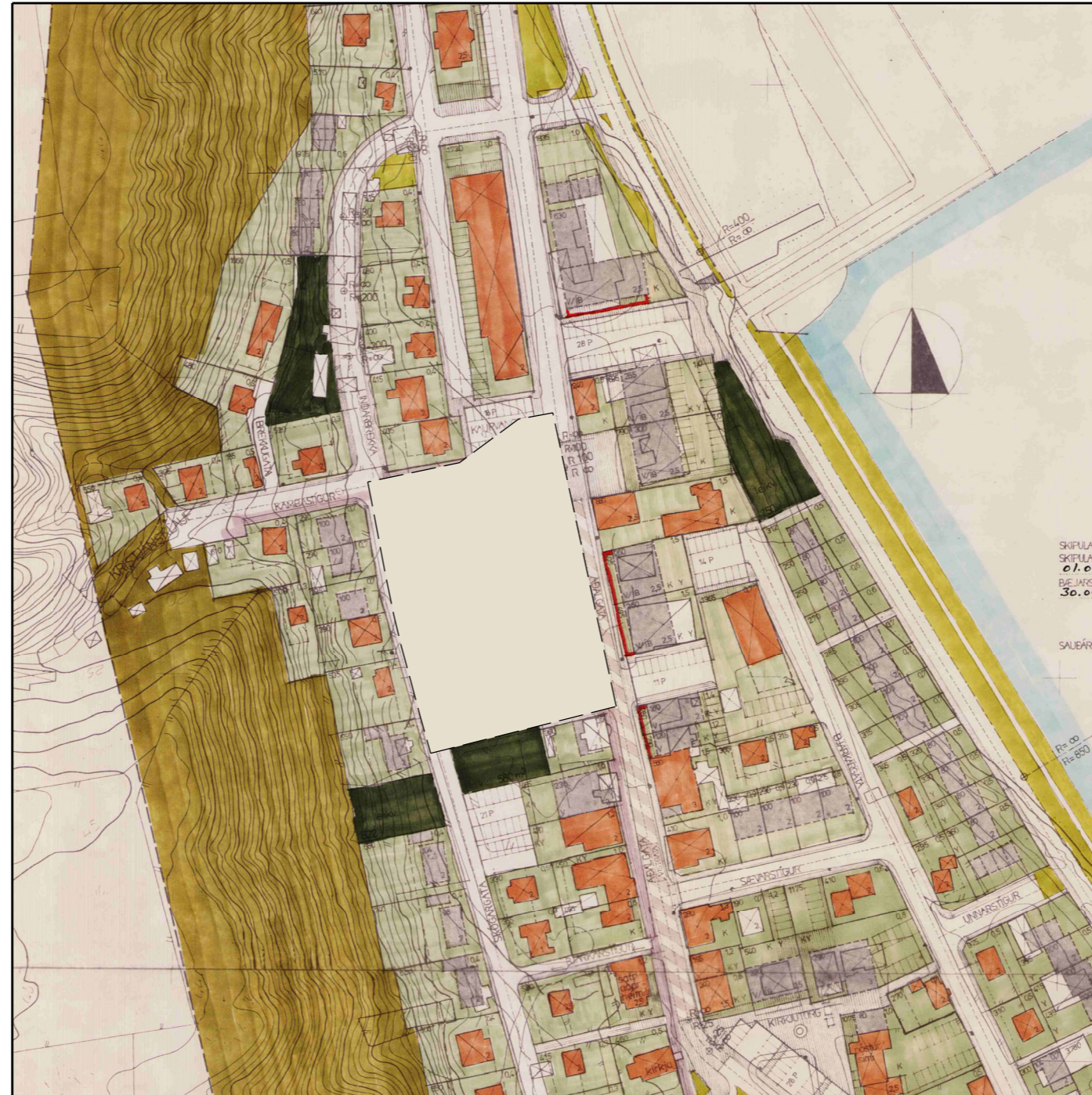
DEILISKIPULAG GAMLA BÆJAR BÆJARINS SKIPULAGSUPPDRÁTTUR - EFTIR BREYTINGU