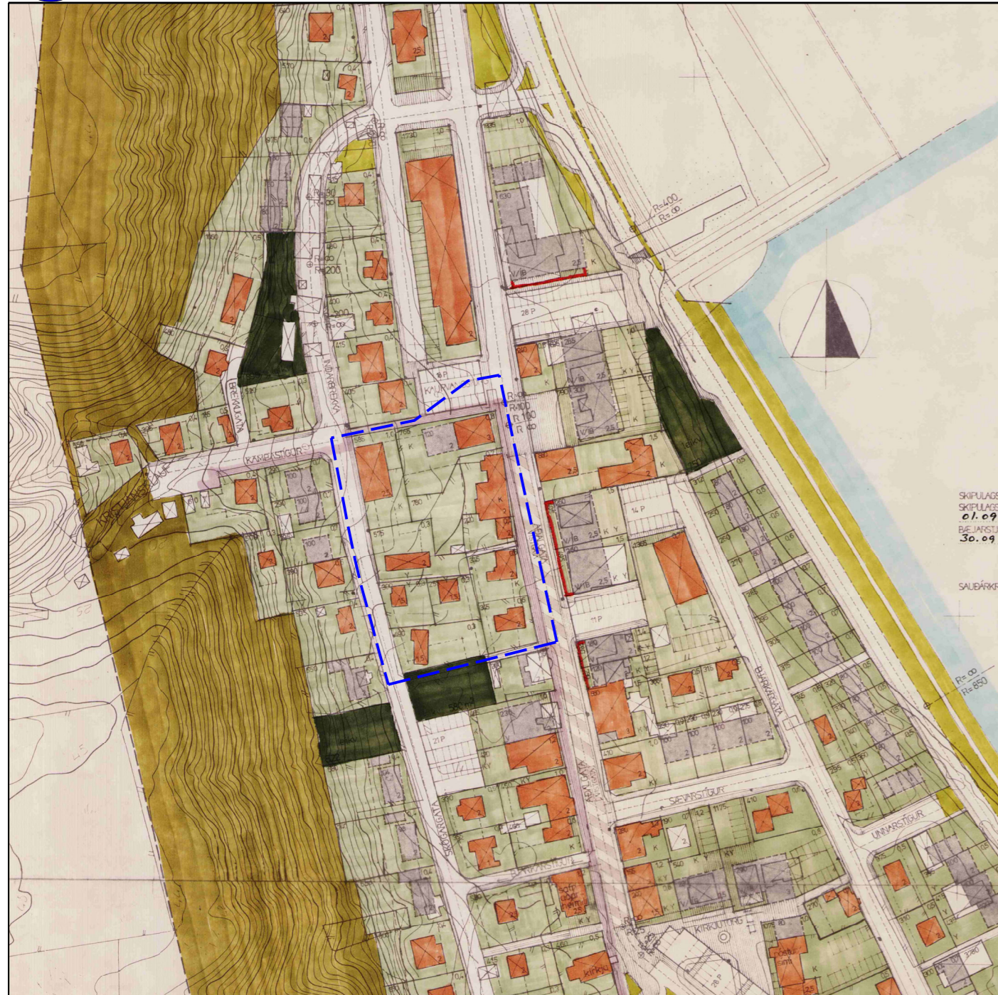
DEILISKIPULAG GAMLA BÆJAR BÆJARINS SKIPULAGSUPPDRÁTTUR - FYRIR BREYTINGU UPPRUNI: ARKÍTEKT ÁRNI